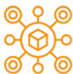
Interoperabilità tra sistemi

Favoriamo la collaboratività integrando e scambiando dati con vari sistemi, quali ERP, MES, CMMS, PLM e sistemi di gestione documentale.